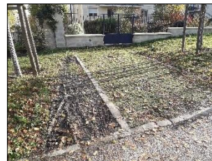
devant le N°43

Nous vous remercions d'avance des mesures que vous pourrez mettre en œuvre pour régler au plus vite ces problèmes. Bien cordialement,