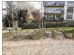
devant le N°41 ter (2 emplacements)