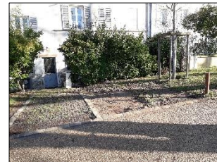
devant le N°27