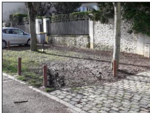
devant le N°6

Nous profitons de ce courrier pour vous rappeler la demande, que nous avons formulée à plusieurs reprises depuis au moins 18 mois, de protection des emplacements utilisés régulièrement et en toute impunité pour du stationnement sauvage, à savoir :